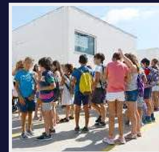
Colegios y Universidades